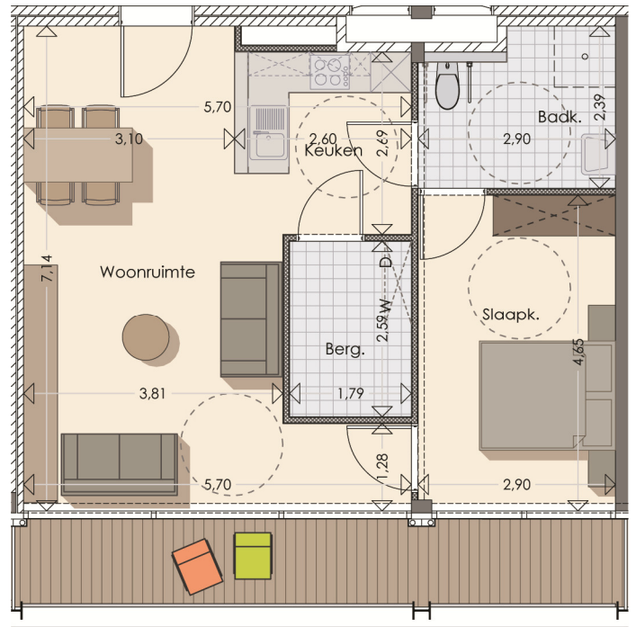
Serviceflat 2.7 (opp. 67,5m 2 - terras: 10,8m 2 )