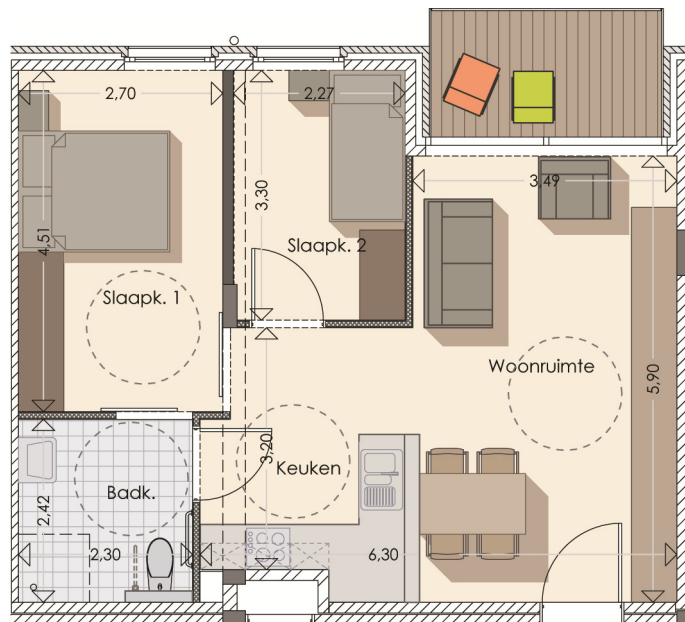
Serviceflat 1.4 (opp. 63,24m 2 - terras: 5,25m 2 )

Meer info vindt u in de rubrieken prijzen en diensten.